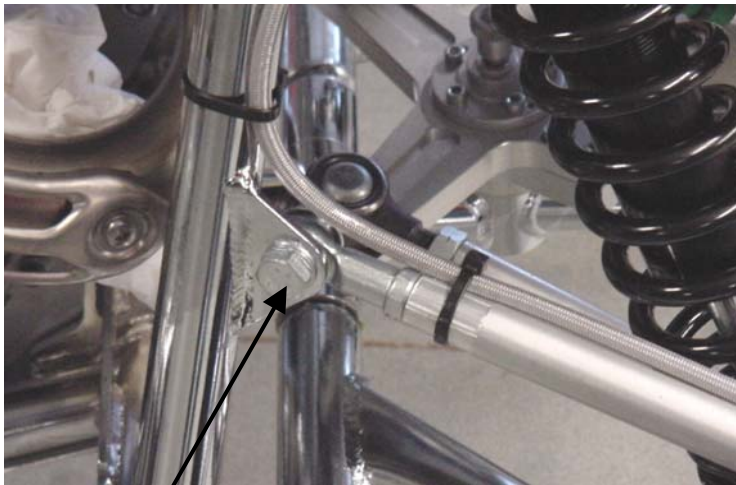
Fig 6. Bolze montieren und Fest anziehen.

Achtung !!! Spur wieder neu einstellen (0,2 – 0,8 cm