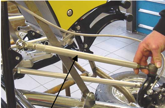
Fig 4. Stange drehen zum neue länge.