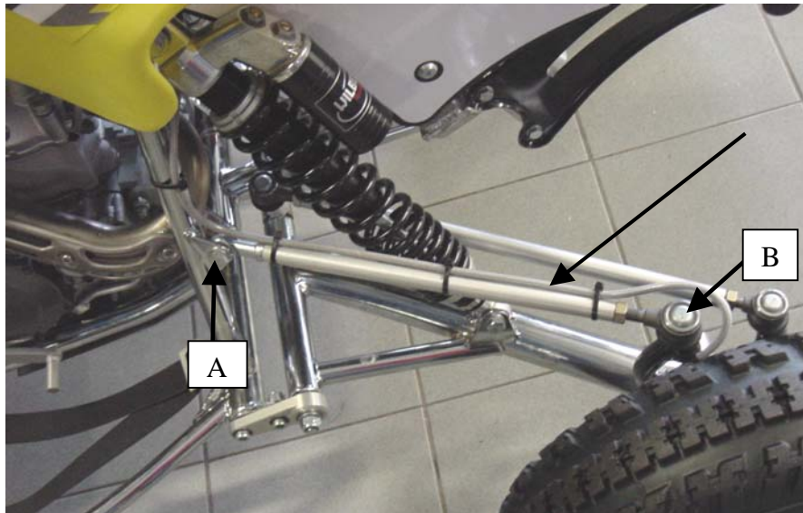
Fig 1: A bis B Zugstange

Stange ist einstellbar. Hartere Strecken langer einstellen. Weiche Sandstrecken kurzer einstellen.